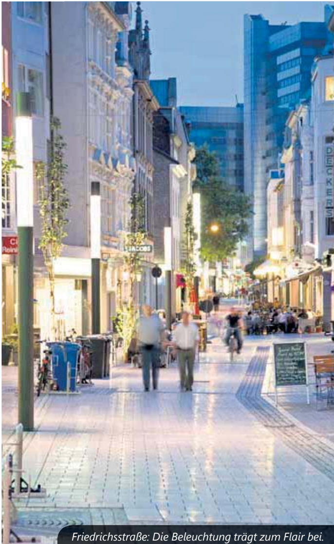
Friedrichstraße: Die Beleuchtung trägt zum Flair bei.